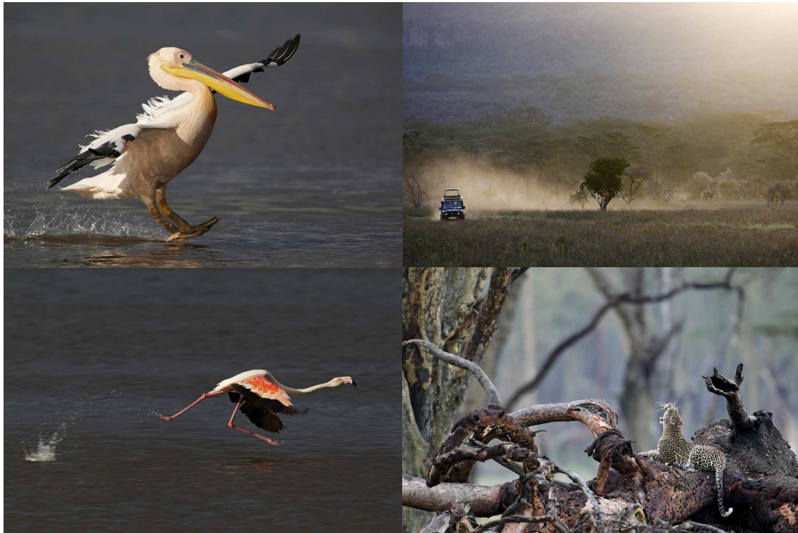
Fotos vom Lake Nakuru

In diesem wunderschönen kleinen Nationalpark sind nicht nur die Flamingokolonien zu bewundern, sondern hier sind auch das Breitmaul- und das Spitzmaulnashorn, sowie die Rothschildgiraffe zu Hause und relativ leicht zu beobachten. Da der Park verhältnismäßig klein und überschaubar ist, besteht auch die Chance, Leoparden, Büffel und die Vogelwelt zu fotografieren, was bei dem scheuen Leoparden natürlich Glück voraussetzt.